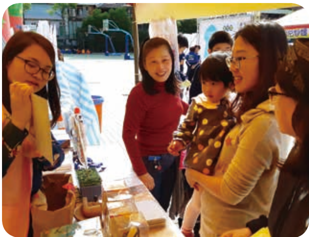
108年11月30日於新民國中新住民子女教育成果展設攤宣導。