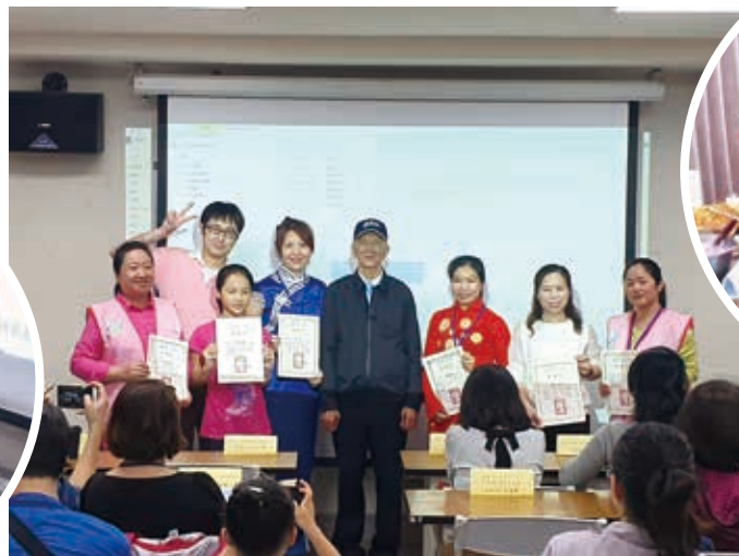
「展珍新·愛公益」志工受獎