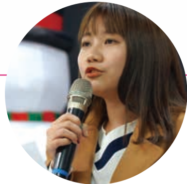
佩佩代表賽珍珠家庭上台代表致詞

佩佩從小父母離異，家中還有一個妹妹和弟弟，均由來自中國的媽媽從事居家清潔工作、獨力扶養長大。為了讓家人有更好的生活品質，媽媽身兼多職；長久累積下來，身體開始出現大大小小的問題，幸好透過賽珍珠基金會的協助，減輕家中負擔。現就讀國立大學藥學系的佩佩，期望在畢業後成為一位藥劑師，藉此改善家中的經濟，給家人更好的生活。聖誕聯歡會當天，佩佩代表賽珍珠家庭致詞，感謝一路上許多人的支持。