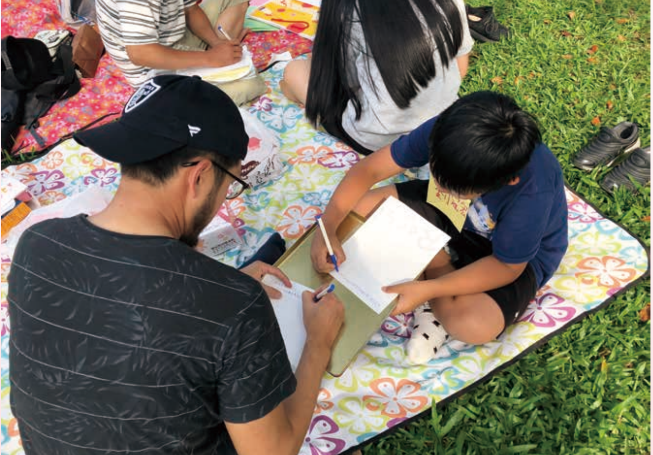
認養人與孩子的關係亦師亦友，除了書信的往來，更可透過「相見歡」活動面對面交流。

有了穩定的認養費，新住民子女們不會因為家庭經濟貧困而失去追夢的機會；同時孩子與認養人之間也會透過書信聯繫彼此，孩子能感受到有人在關懷、鼓舞他們。看到本會扶助孩童得以健康快樂的成長，我們很感謝善心企業與社會大眾的愛心。也衷心期盼著您及更多善心人士的加入，不管是成為認養人陪伴孩子成長，或是小額捐款支持我們新一年的助學服務費用，您的祝福都將成為經濟弱勢新住民子女及其家庭的能量，陪伴他們展翅飛翔。