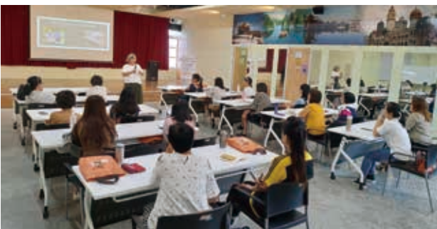
筆者分享自身通譯經驗，幫助更多通譯人員。

我倆這一學期的轉變不僅提升了她的學習效率，增加知識技能，對我個人的通譯服務能力、人際關係的溝通互動都有很多的成長。通譯陪讀最大的滿足和成就是看到孩子的進步、燦爛的微笑。與她共享的時光和創造的回憶，是一股很強的力量，使我可以在這份工作上持續奮鬥。