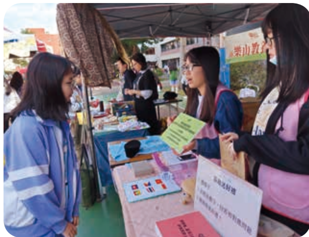
108年12月28日於金陵女中進行多元文化宣導。