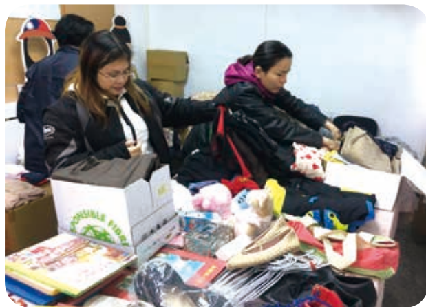
108年11月20日辦理愛心二手物資市集。