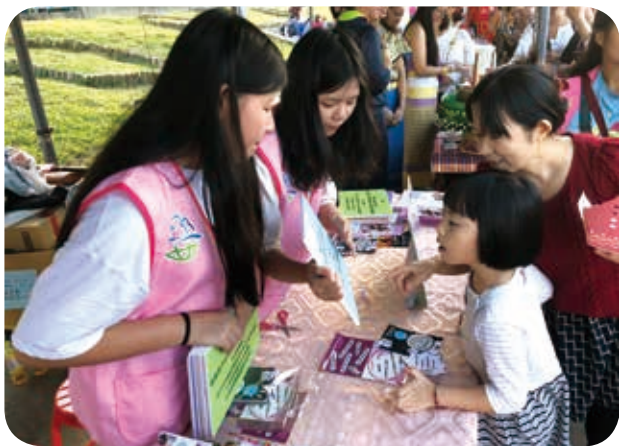
108年11月17日於臺北市政府水燈節進行多元文化宣導。