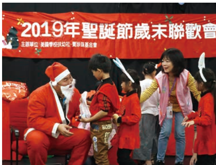
孩子們開心地從聖誕老公公手上接到禮物。