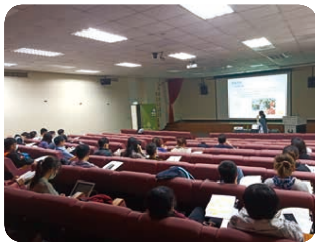
109年2月4日於市立聯合醫院(和平院區)分享多元文化。