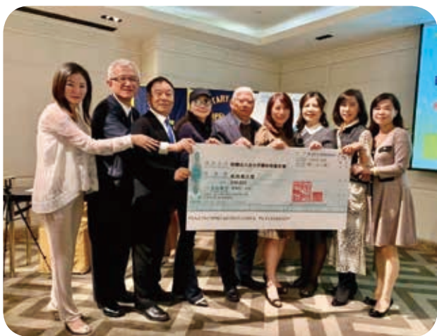
109年1月10日安和扶輪社捐款支持本會服務。