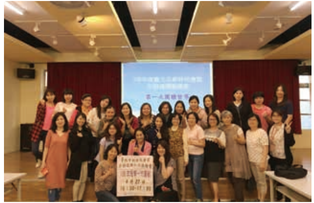
通譯人員定期透過專業課程增進自身技巧。

後來回想：我們的服務初衷是幫助孩子融入校園生活，非常單純。因此我提醒自己，要試著站在她的立場想事情，瞭解、同理她跨文化、跨語言的學習有很多艱難挑戰，內心的衝擊和壓力並非一般。於是我想辦法學習與她互動，調適自己不急於把老師講課翻譯完，重點放在她每節課確實有學到